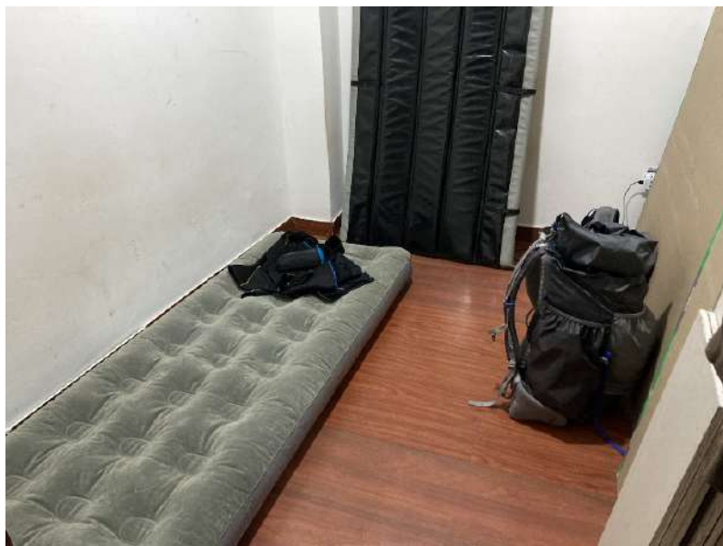
Obr. 1 Plzeň, domov v nocležišti (2011)

Právě tato zkušenost mě přivádí zpět k otázce, jaké typy politických a urbanizačních efektů jsme v evropském kontextu ochotni v nocležištích vůbec rozpoznat. I proto se vlastně badatelé a badatelky ve výzkumech (ne)formálních kempů a stanových táborů v USA v posledních letech inspirovali právě pracemi o periferiích měst „globálního Jihu“. Díky tomu dnes můžeme číst analýzy, které ukazují, že aktérství lidí bez domova nelze redukovat ani na apolitickou adaptaci na dané podmínky, ani na předpolitickou kulturní (opoziční) identitu. Kam však tento tematický a epistemologický proud směřuje v českém výzkumu nocležišť a městského bezdomovectví obecně? Především bych varoval před nekritickým přejímáním konceptuálních