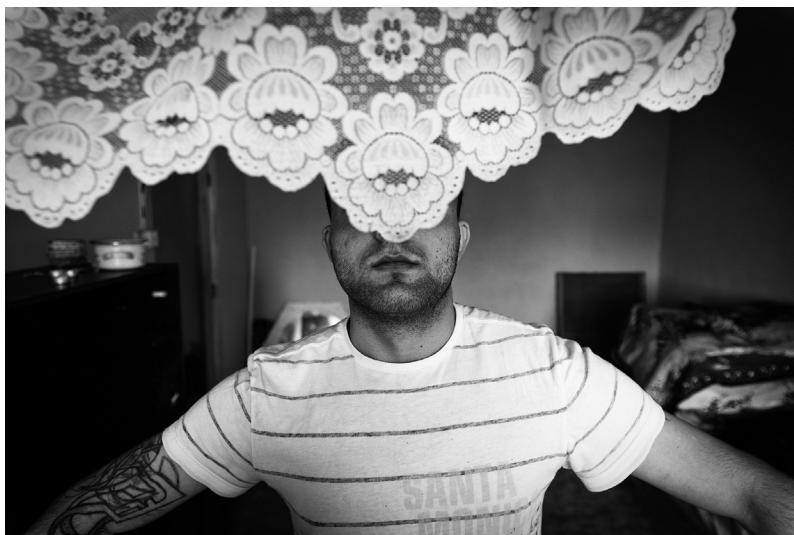
V Chanově, v jednom z bytů dealerů pervitinu