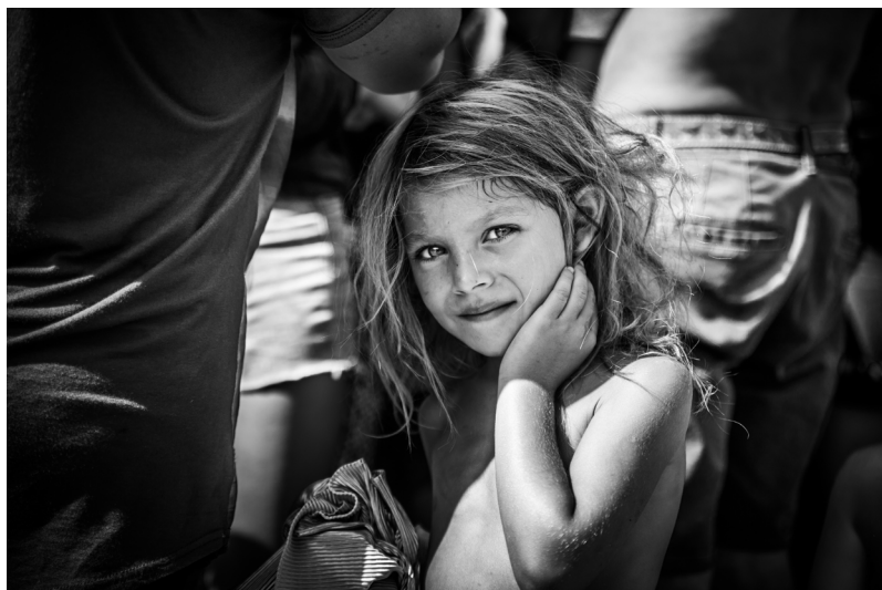
Dívka z osady na východním Slovensku