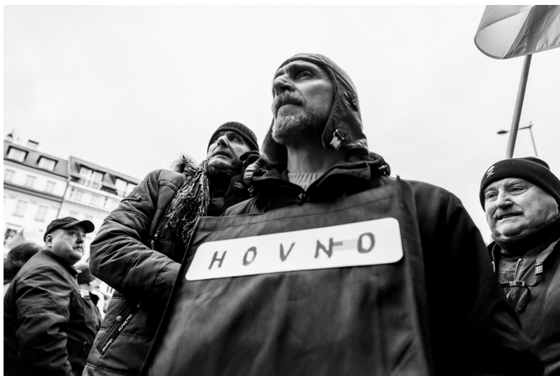
Z vlastenecké demonstrace v ulicích Prahy