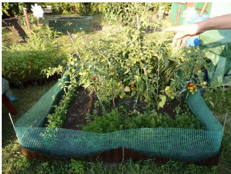
Obr. 2 Co a jak při pečování o život.

Ještě podstatnější je možná ale skutečnost, že na zahrádkách se ani péče, ani soužití netýká jen lidí. Naprosto zásadní součástí zahrádky jako