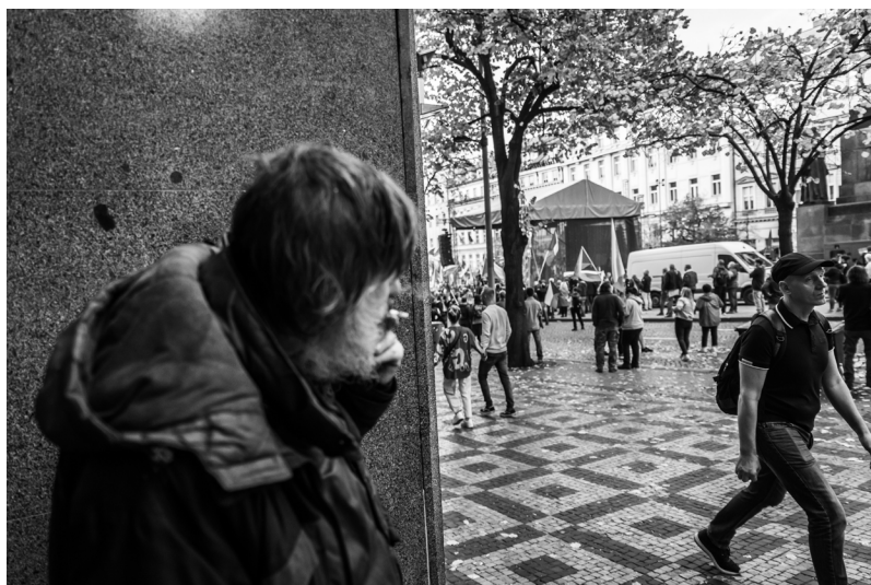
Muž bez domova pozoruje dění na Václavském náměstí, kde právě probíhá vlastenecká demonstrace