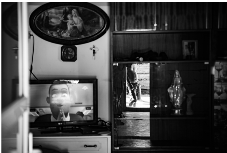
Pohled do příbytku v osadě Hermanovce na východním Slovensku