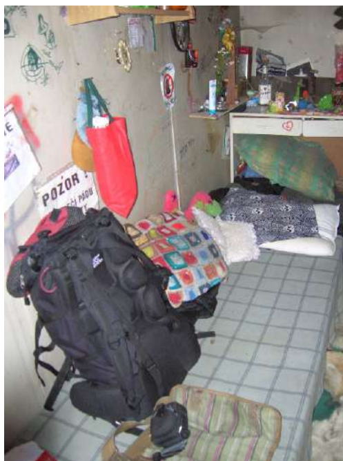
Obr. 2 Bogotá, domov ve svépomocně postaveném domě (2024)

a tematických inovací. Nemyslím si například, že by lidé bez domova v českých nocležištích prostřednictvím sdílení a péče systematicky „zpochybňovali dominantní ideologie domácího prostoru“ v tom smyslu, jak to popisuje Speer (2017, s. 527). Přesto jsem přesvědčen, že tímto způsobem je třeba o českém kontextu přemýšlet. Ačkoli jsme se v poslední dekádě v Česku naučili psát o bezdomovectví za rámec pouhých překérních podmínek a adaptace na ně – směrem ke kulturnímu a politickému vytváření v rámci jednotlivých komunit lidí bez domova –, stále nám činí potíže uvažovat o tom, jak jejich každodenní praxe dopadají na různé roviny městotvorby. Jinými slovy – vidět bezdomovectví nejen jako jakýsi indikátor změny ve městech a společnosti, ale také rozpoznat lidi bez domova a jejich praktiky jako aktivní součást procesů urbánní transformace (Ferenčuhová & Vašát, 2021).