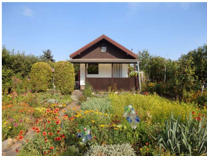
Obr. 1 Ze zahrádky v jedné pražské zahrádkové osadě.

Zahrádka je tedy prostorem přináležení a jako taková se stává i součástí domova. Pokud zahrádkám přiznáme to, že jsou součástí domova, že jde