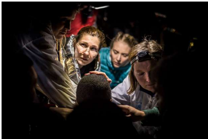
Zdravotníci pomáhají uprchlíkům z člunů na ostrově Lesbos. Ke břehům často dorazili prokřehlí a vyčerpaní z plavby na gumových člunech, často v noci a za nejistého počasí. Mnoho z nich plavbu nedokončilo. Uprchlíká krize 2015/2016